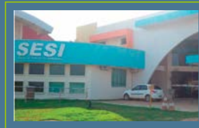
SESI - JI-PARANÁ/RO Rua Francisco Benites, nº 435 Aurélio Bernardes, Ji-Paraná/RO Tel.: +55 (69) 3421-3921