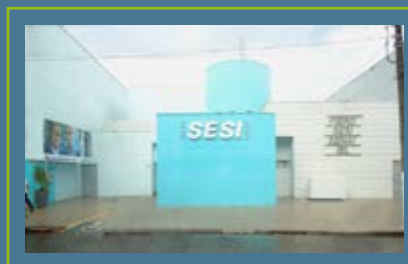
QUALIDADE DE VIDA - CACOAL/RO Av. 07 de Setembro, nº 2674 - Centro Cacoal/RO - Tel.: +55 (69) 3443-2225