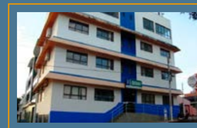
UNIDADE SENAI CACOAL Av. São Paulo, 2427 - Centro Cacoal/RO Tel.: +55 (69) 3441-3093