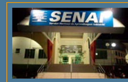
UNIDADE SENAI JI-PARANÁ Rua Antônio Benites Lopes, 435 Aurélio Bernardes - Ji-Paraná/RO Tel.: +55 (69) 3421-6535/1270