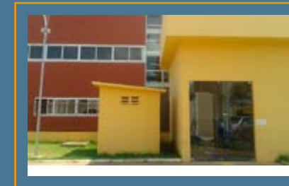
SENAI CEET - Sebastião Camargo Rua Matrinchá, 895 - Lagoa Porto Velho/RO Tel.: +55 (69) 3225-3392